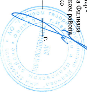
Схема газоснабжения д.Прислониха Ивановского муниципального района